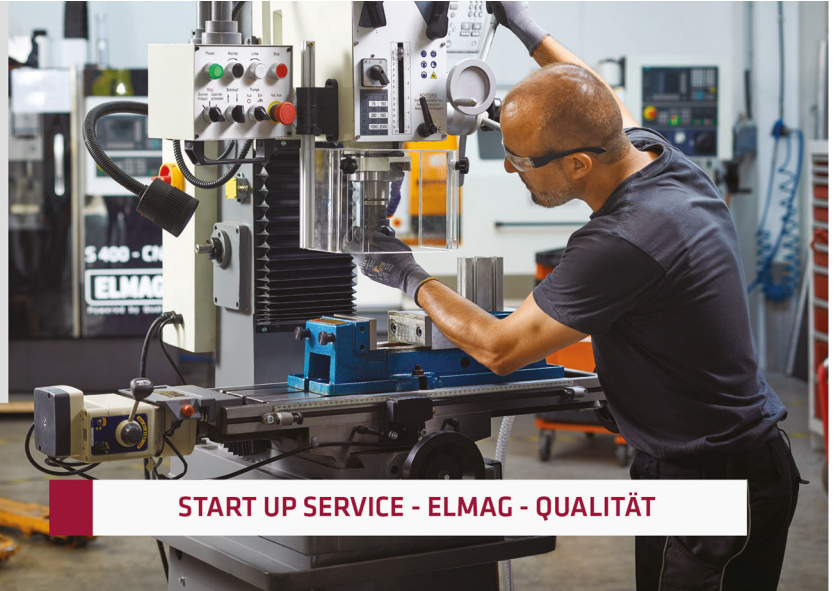
START UP SERVICE - ELMAG - QUALITÄT